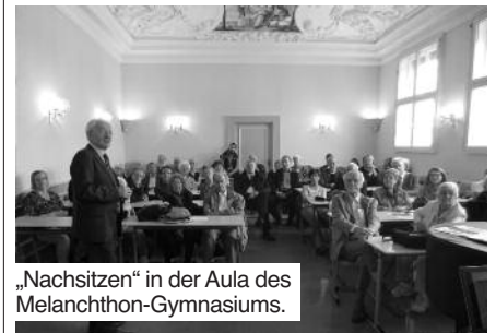
„Nachsitzen“ in der Aula des Melanchthon-Gymnasiums.