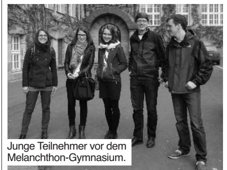
Junge Teilnehmer vor dem Melanchthon-Gymnasium.

Kostümführung im Dürer-Haus: Zum Ausklang führte am Sonntag "Agnes Dürer" durch die Gemächer des Dürerhauses. Anschließend wurde in der Kaiserburg in der neuen Dauerausstellung KAISER-REICH-STADT die Kopie des Merkel'schen Tafelaufsatzes bewundert.