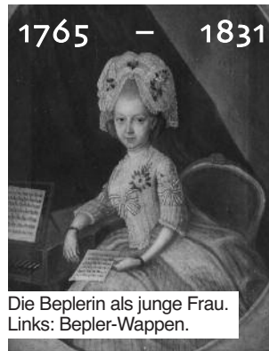
Die Beplerin als junge Frau. Links: Bepler-Wappen.

Es erfüllt uns mit großer Freude, dass im Jahr ihres 250. Geburtstagjubiläums die Paul Wolfgang Merkel-Tagebücher erscheinen können, und damit der Ehefrau von Paul Wolfgang Merkel eine ganz besondere Ehrung zuteil wird.