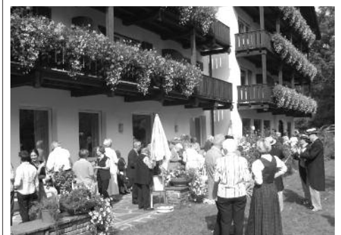
Willkommen im Hotel Perwanger in Völs.

Unser Programm beinhaltet neben viel Zeit zum persönlichen Gespräch, Frühstück und gutem Essen im Hotel die Möglichkeit, die Landschaft und Kultur am Fuß des Schlern und unterhalb der Seiser Alm im Früherbst kennenzulernen. Geplante Programmpunkte sind u.a. ein geselliger Familienabend mit Kultur, Musik und Vortrag, die Möglichkeit, Einblick in die Südtiroler Küche zu nehmen, die Besichtigung des im 12. Jahrhundert erbauten Schloß Prösels, der Besuch der Seiser Alm für Wanderlustige mit Wanderaus-