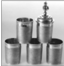
Fünf Satzbecher mit Deckel, Silber getrieben, vergoldet, Nürnberg, Paulus Fischer, um 1650